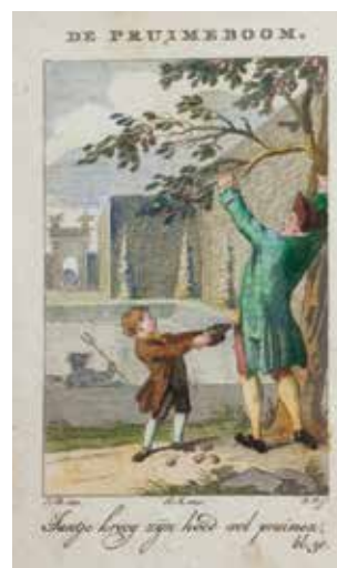
Gravure bij 'De pruimeboom'.