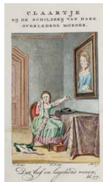
Gravure bij 'Claartje bij het schilderij van hare overledene moeder'.