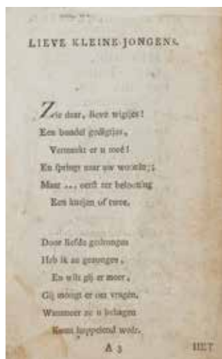
Eerste pagina van het openingsgedicht 'Lieve kleine jongens'.